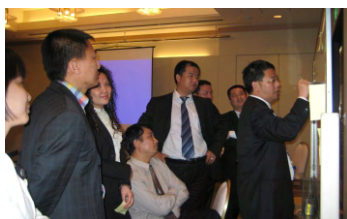
考察总结会上学员间热烈交流和讨论