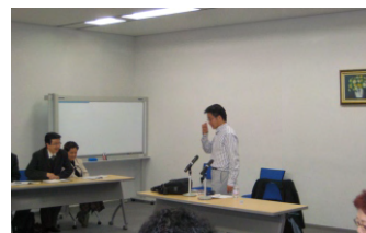
与日本知名华人企业家宋文洲先生座谈