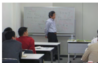
庆应大学花田光世教授讲授企业组织力的提升