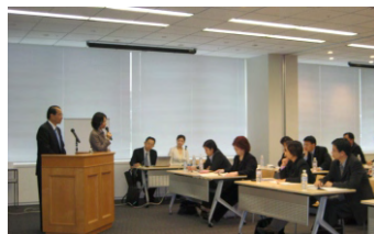
聆听富士施乐前任总裁的企业改革心得

从制造工厂的参观到深入到知名企业中与经营管理层的亲自对话，了解日本企业管理与欧美之不同。并与当地的中小企业家座谈，借鉴他们的成长经历。