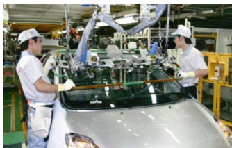
参观丰田工厂，学习丰田生产方式